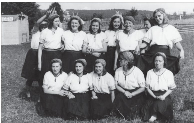
Okrskové cvičení v Novém Rychnově, ženy, r. 1946