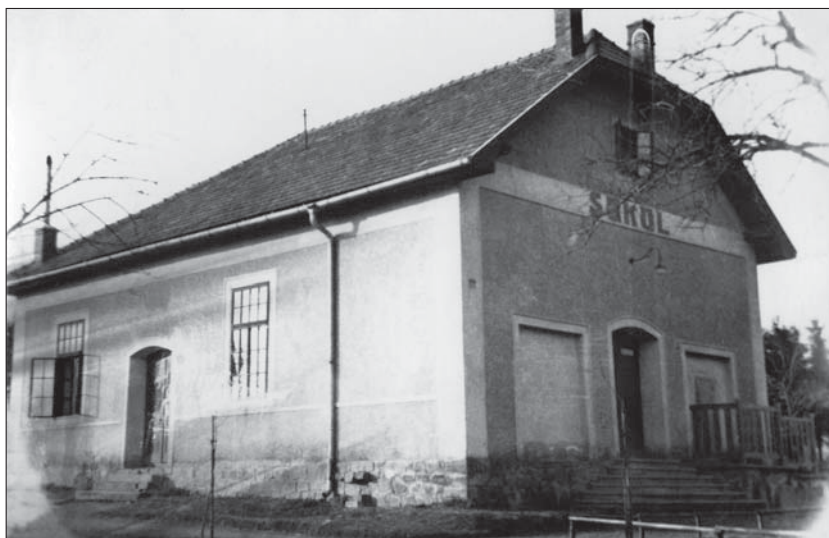
Sokolovna, původní budova, r. 1925