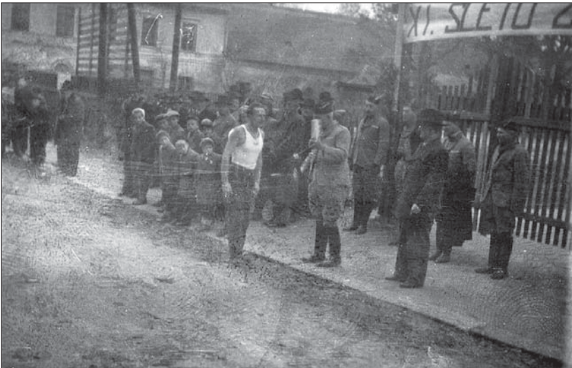
Vstup na sokolskou zahradu