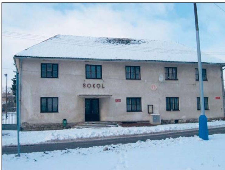
Jižní pohled na sokolovnu