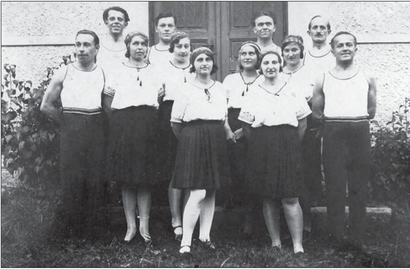
Cvičitelský sbor, r. 1932