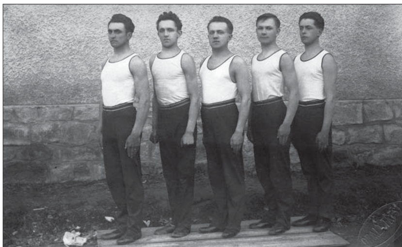
Tělocvičná akademie, r. 1928