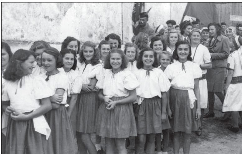
Sokolský den, r. 1945