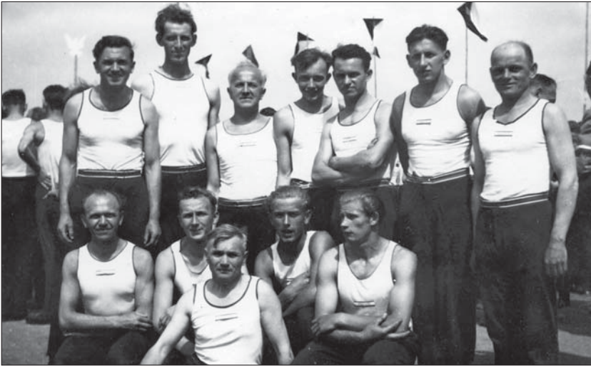
Předletové vystoupení v Třebíči, r. 1947