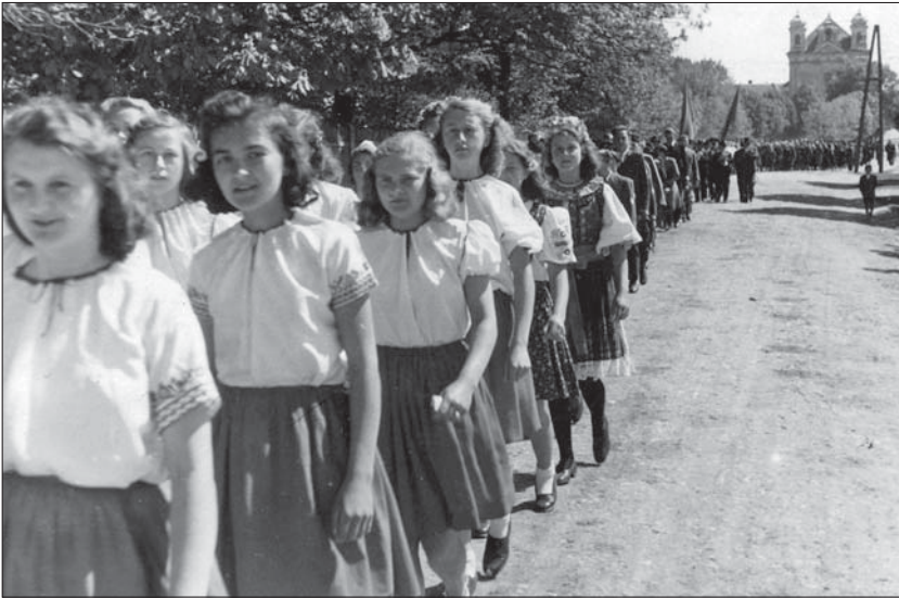
Ženy a dorostenky