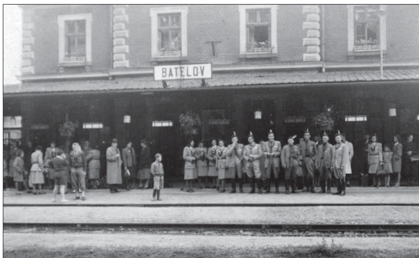
Praha – XI. slet, r. 1948 Odjezd z nádraží v Batelově